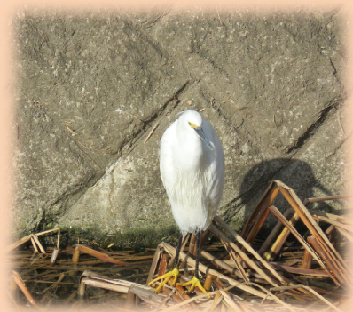
黄色い長靴をはいたようなコサギ

申込方法：往復はがき、FAX、e-メールにて参加者全員の 氏名(ふりがな) 年齢 性別 郵便番号 住所 電話番号(できれば携帯電話番号) この観察会を知った経緯を ご記入の上、お申し込みください。 1月15日(日)必着