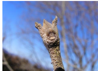
アカメガシワの冬芽