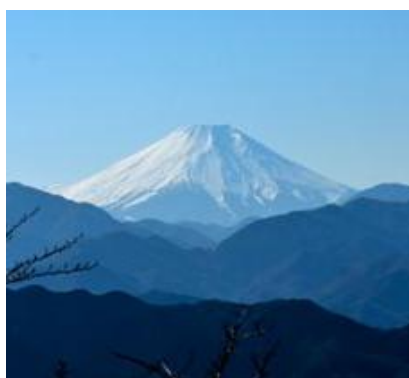
お天気がよければ富士山も！