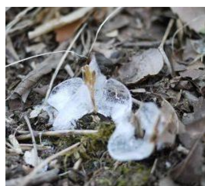
運がよければシモバシラも！