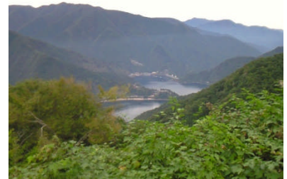
奥多摩湖と小河内ダム