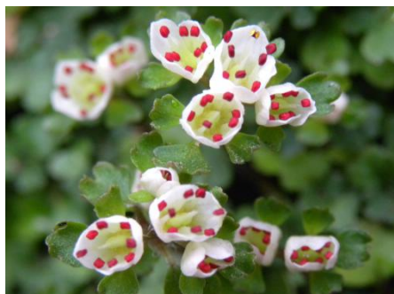
ハナネコノメソウ