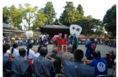
毎年10月19日に行われる高麗神社例大祭