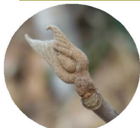
アカメガシワの冬芽