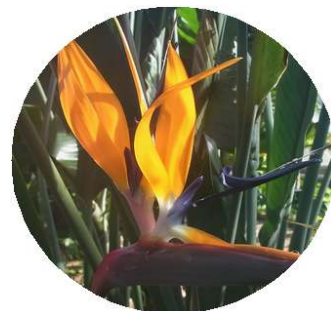
ゴクラクチョウカ(温室)