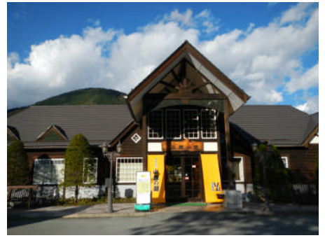
やっと来ました小菅の湯