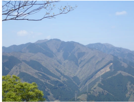
岩茸石山からの川苔山