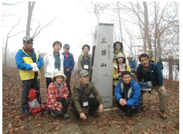
すっかり葉っぱを落とした三頭山山頂で