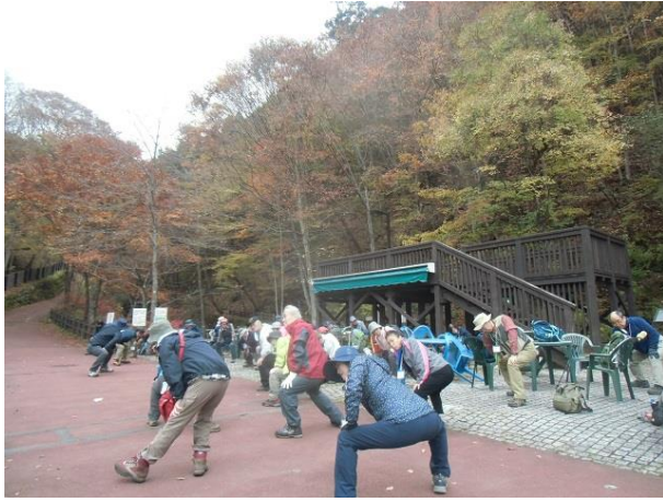
出発前に入念に準備体操