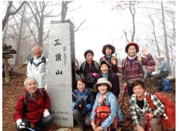
三頭山西峰の新標識を囲んで