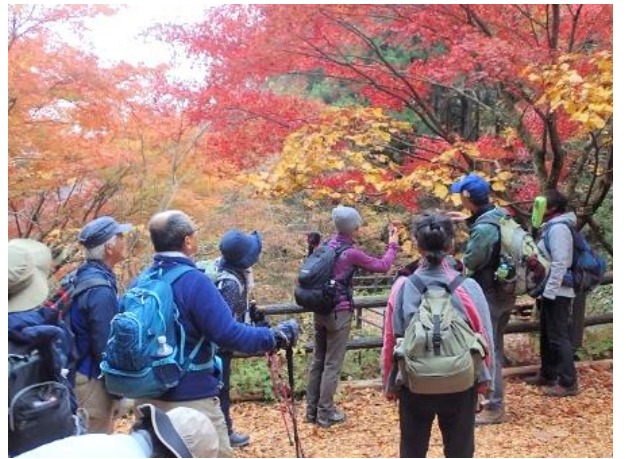
ダンコウバイの実・黄葉・冬芽を観察