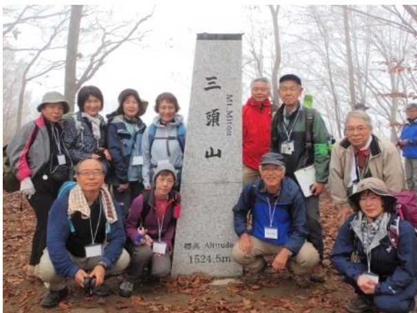
晴れていれば雲取山をバックに