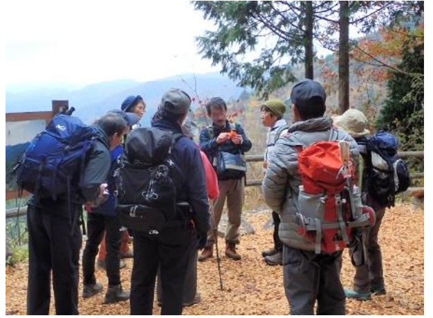
カエデの紅葉について解説