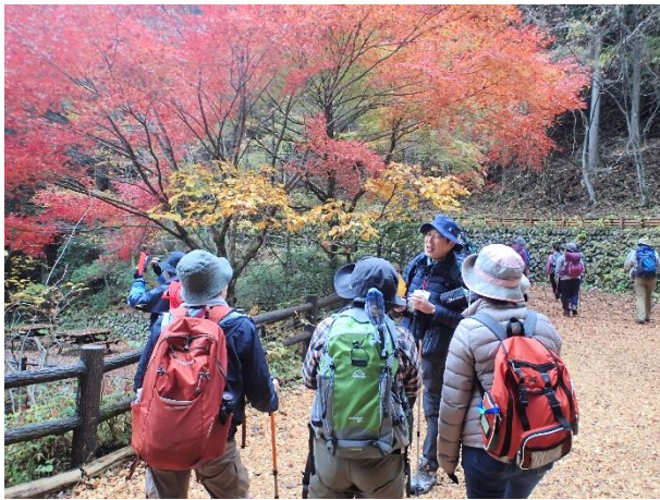
葉っぱの紅葉・黄葉について説明